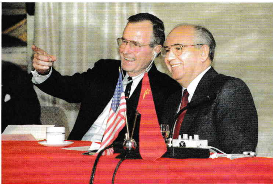
George Bush și Mihail Gorbaciou la întâlnirea din Malta (2–3 decembrie 1989)

perfect, dar tocmai de aceea refuza cu atâta încăpățânare să ia cunoștință de realități. 1