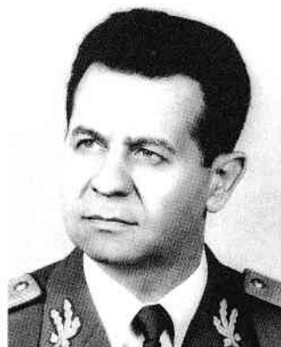
Gen. Constantin Olteanu

Constantin Olteanu își amintește: „Eu l-am chemat pe ambasadorul sovietic și i-am adus la cunoștință componența delegației noastre. I-am